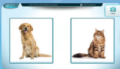
Editor für die multimediale Kommunikation